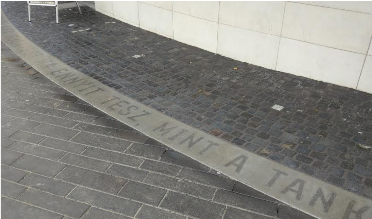
9 - Móricz Zsogmond Körtér – 1956-os emlékmű