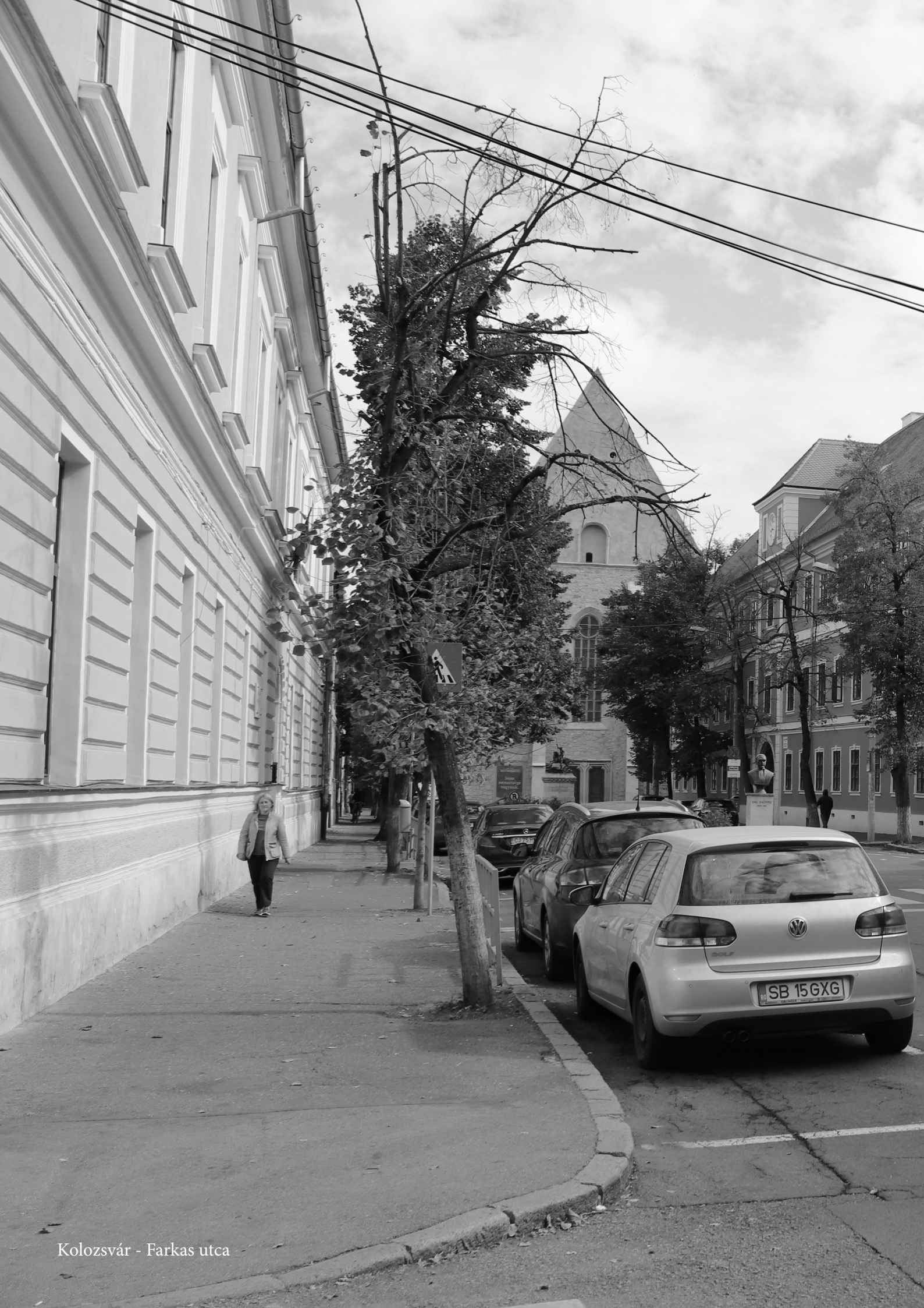
Kolozsvár - Farkas utca