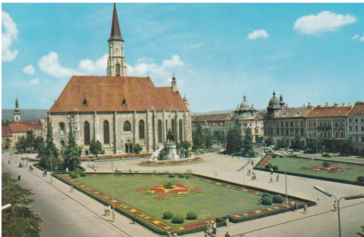
10 - A Fő tér átalakítás előtt

Sámuel volt, kinek nevéhez fűződik az Erdélyi Múzeum alapításának gondolata, melyet az 1842-1843-as országgyűlésen ismertettek. Érdekessége, hogy az épület vendégei között megtalálhatjuk Deák Ferencet és Vörösmarty Mihályt is. 1