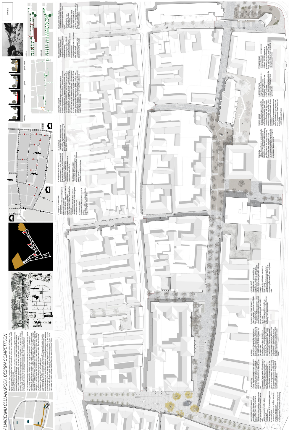
6 - A Mossfern iroda átalakítási terve