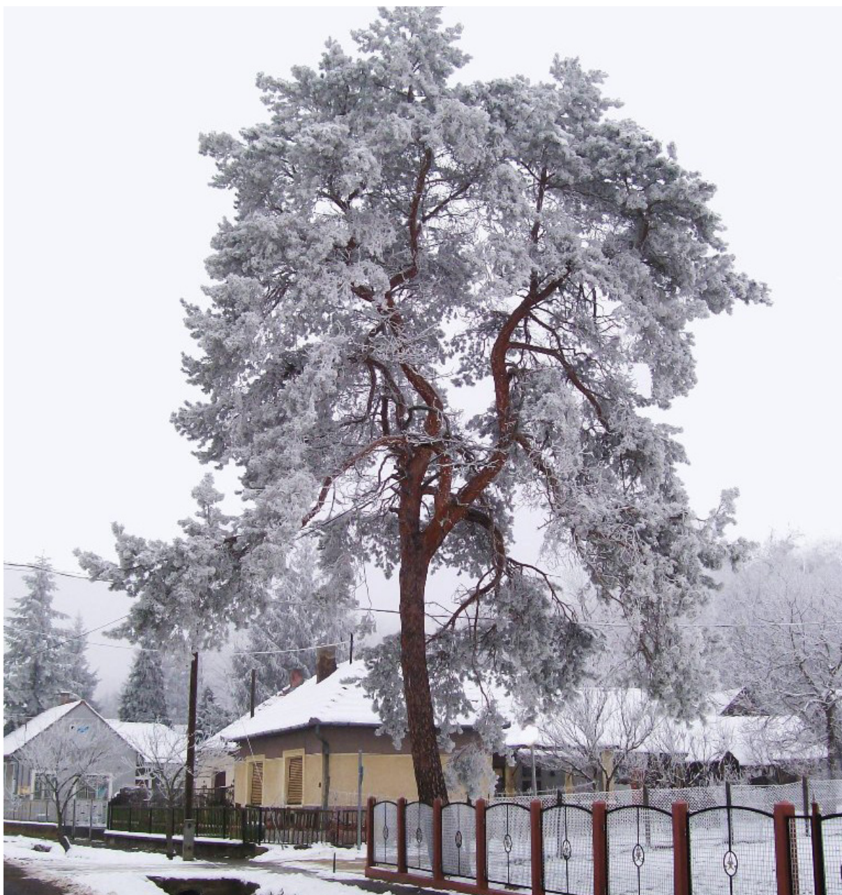
7 - Zalaújlak - Erzsébet Királyné Emlékfája

fák megőrzése, nem pedig az egységes kép kialakításának oltárán való feláldozása, ha nem is szándékos építészeti gondolatként, de egy olyan kezdeményezés előtti tiszteletként értelmezhető, melyek a város arculatának javítása érdekében, még Haller Károly korából származnak.