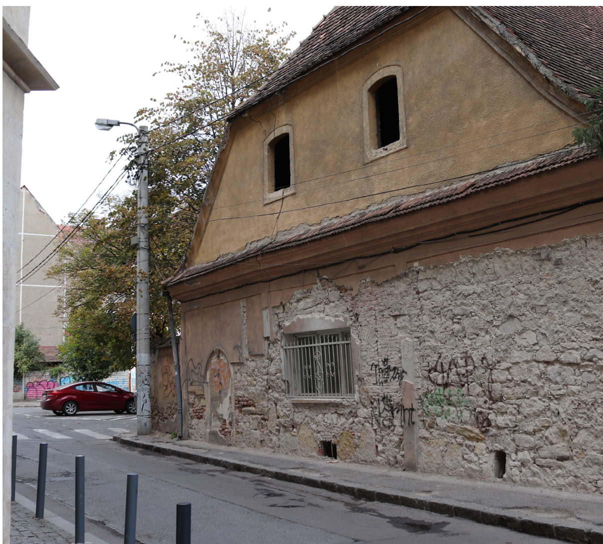
3 - Pap lak jelenlegi állapota

részletképezései. Érdekes megfigyelnünk, hogy a számos építési periódus megjelenésének ellenére, az utca mégis egységes képet mutat. Ezt az egységet nem feltétlen az épületek léptekében, vagy homlokzatában láttam, hanem a különböző részletképezésekben, azok kidolgozottságban. Egy kovácsolt vas kapukilincset vagy egy Bauhaus-ajtó fogantyúját ugyanaz az igényesség, ugyanaz az aprólékosság, gondos alkotói munka hozta létre. Ez a gondoskodás és múlthoz való kötődés volt később az, amelyet a kortárs átépítések terveiben az építészekkel való beszélgetés kapcsán kerestem.