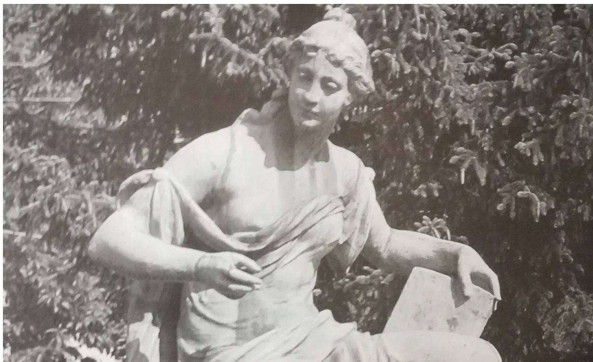
1 - A Tudományegyetem homlokzati szobra a Botanikus kertben

Az egyetem előtt helyezkedik el a Báthory István elméleti líceum, mely jelenlegi helyén 1727 óta működik. Vezetésével 1776-tól a piarista rendházat bízták meg. 1850-től pedig mint főgimnázium tartják számon. Az 1948-as években a román tanügyi reform következtében elvették az épületet a katolikus egyháztól. Az idők során több megnevezés alatt folyt oktatás az intézményben, mint például Magyar Pedagógiai iskola, 11-es számú magyar tannyelvű iskola vagy 3-as számú Matematika Fizika líceum. Az iskola története során olyan jelentős személyiségek fordultak itt meg, mint Haller János, Teleki Sándor honvéd ezredes, Avram Iancu jogász. A jelenlegi épületet az 1798-as tűzvész után építették, melynek tervezése Winkler György és Kiermayer Keresztély vezetésével történt. Hogy a történeti korok rétegződése nem csak szellemi értelemben figyelhető meg, jól mutatja, hogy az építés során a kolozsmonostori templom köveit is felhasználták. 1