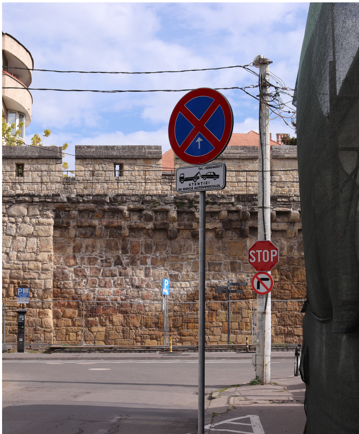
5 - A régi várfal és környezete