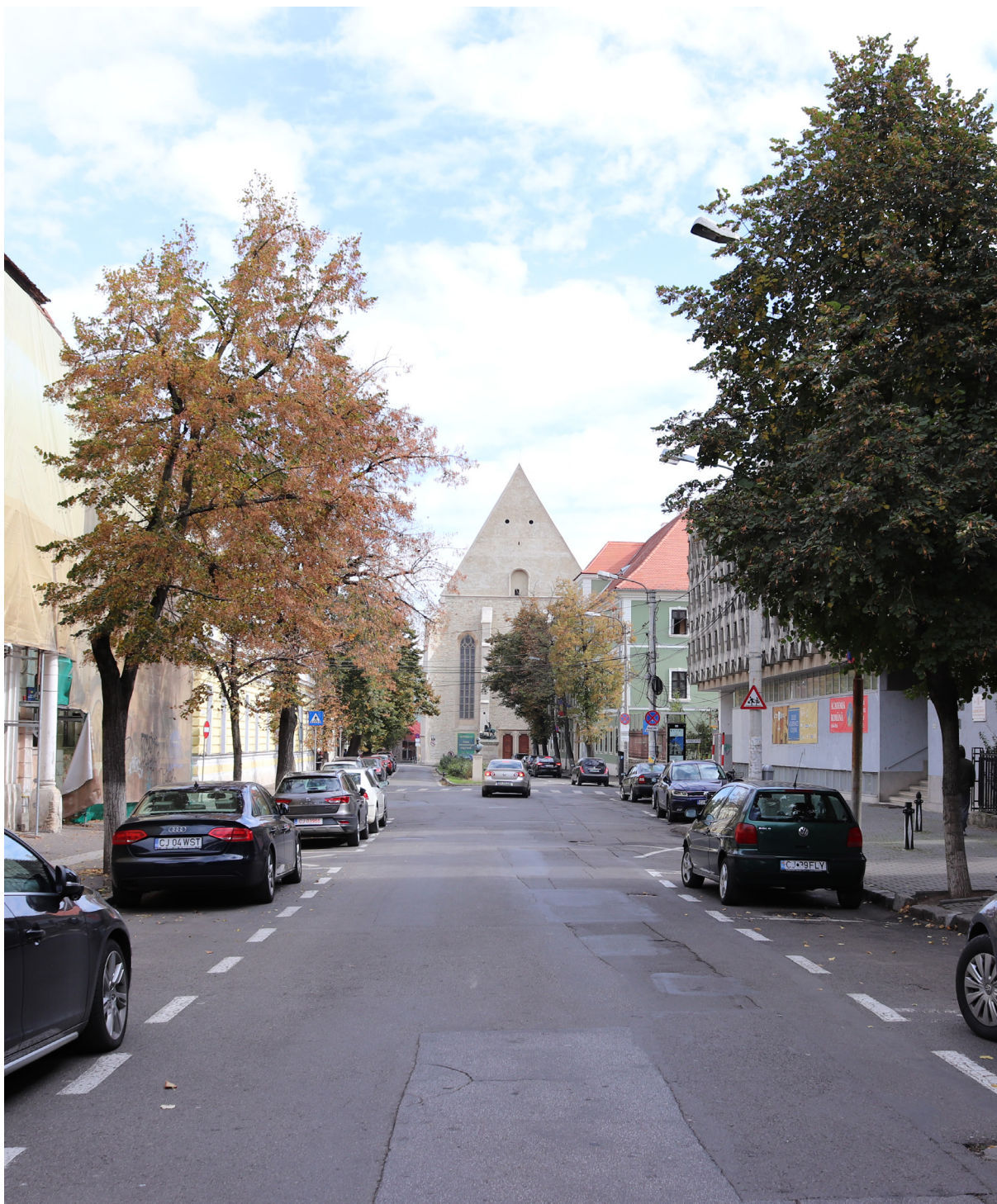
4 - Református templom teljes feltárulása