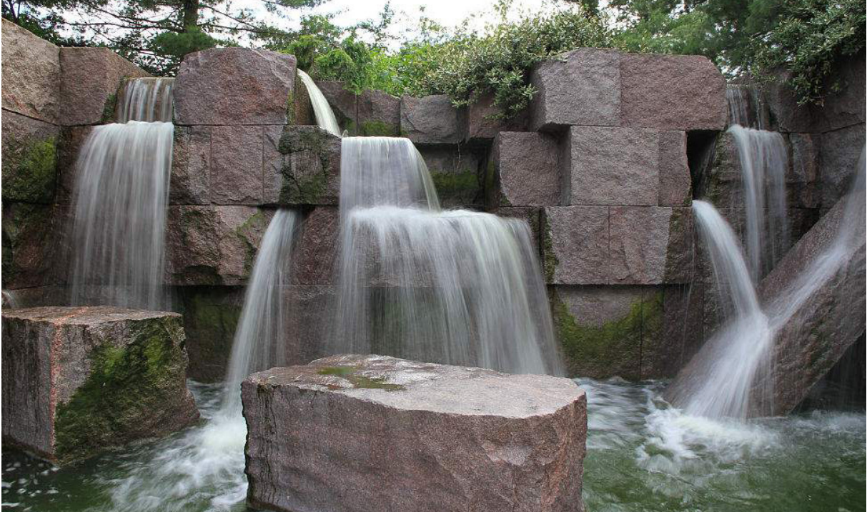
8 - Franklin D. Roosevelt emlékmű vízese