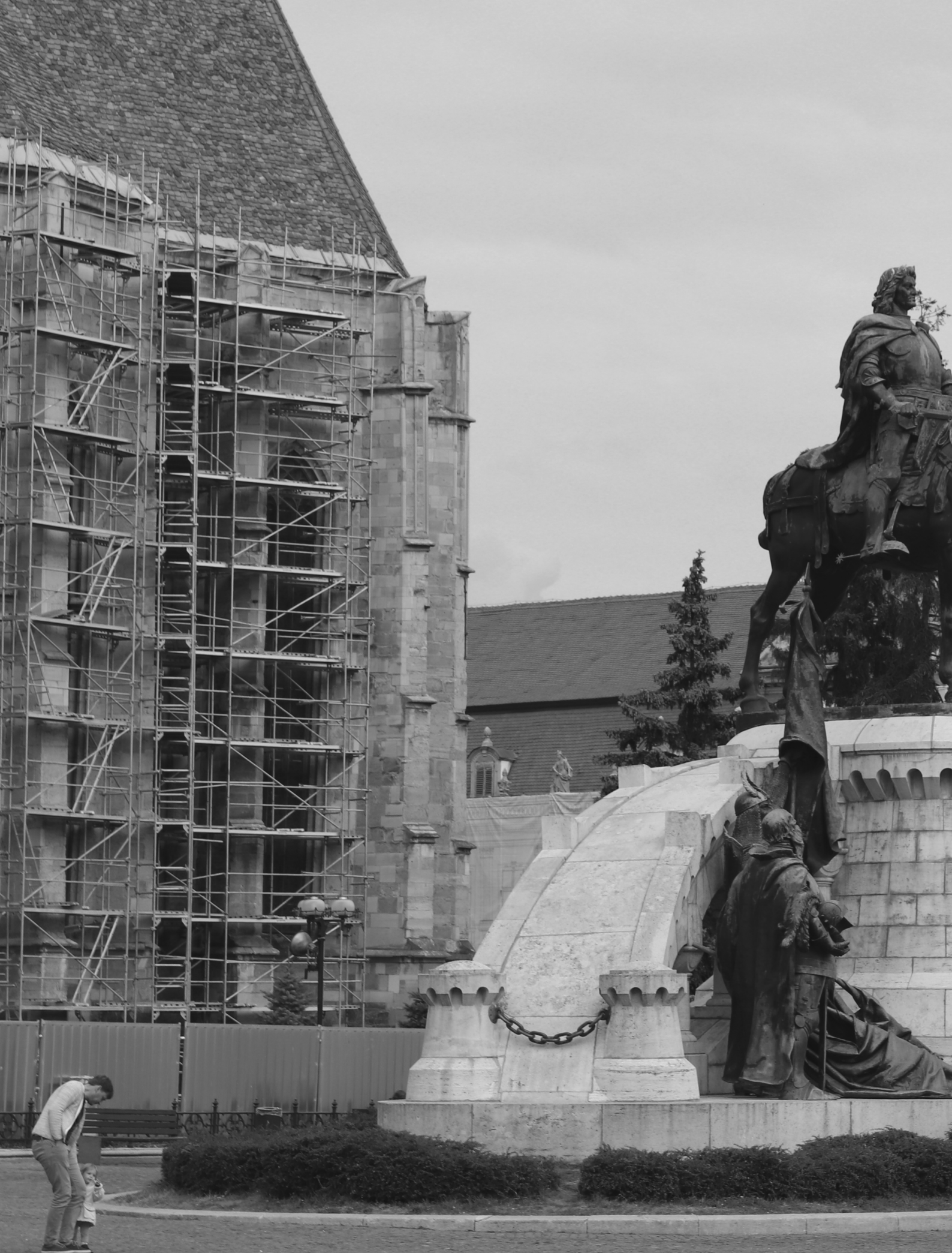
Kolozsvár - Fő tér - Mátyás szobor