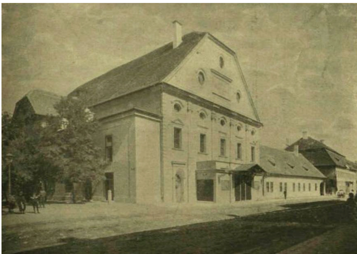
2 - Farkas utca -Kőszínház

A következő épület kétségkívül az egyik legérdekesebb történettel rendelkező alkotás, mely nem más, mint a Farkas utcai színház. A nemzeti színház terveinek elkészítésére már a 18. században felmerült az igény és az 1794-1795-os országgyűlés során bizottságot állítottak fel és gyűjtést indítottak a munkálatokhoz szükséges források beszerzésére. Ennek köszönhetően a színház területének megvásárlására 1803. július 13-án került sor, amikor a református intézettől két szomszédos telket adtak el. Később egy harmadik telek megvételével négyzet alakúvá vált a felhasználható építési terület. A színház tervezését Schütz Antal és Alföldi Antal építész végezte. A Farkas utcai színház vagy másik nevén Kőszínház megnyitása 1821. március 12-én történt, melyen elsőként Carl Theodor Korner Zrínyi című alkotását mutatták be. Fennállása során számtalanszor küzdött anyagi problémákkal, megmaradása sokszor csak a színház kedvelő közönségnek tulajdonítható. Sajnos az épületet 1903-ban tűzveszélyesnek nyilvánították, ezért 1906-ban megépítették a Hunyadi téri színházat. Búcsúzásképpen az intézmény újra előadta néhány 1821-ben bemutatott előadását, illetve a Bánk Bán című alkotását, melyben