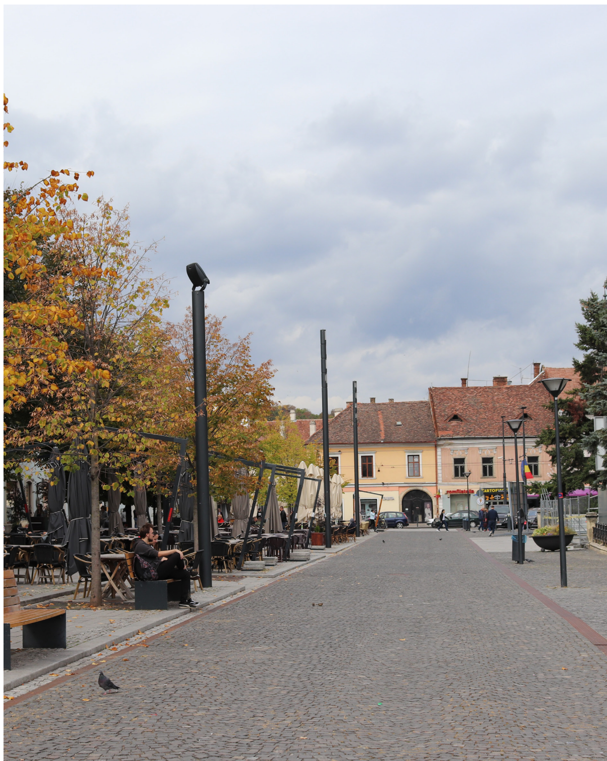
11 - A Fő tér - burkolati jelzések

A Fő tér átalakításának rövid ismertetése: