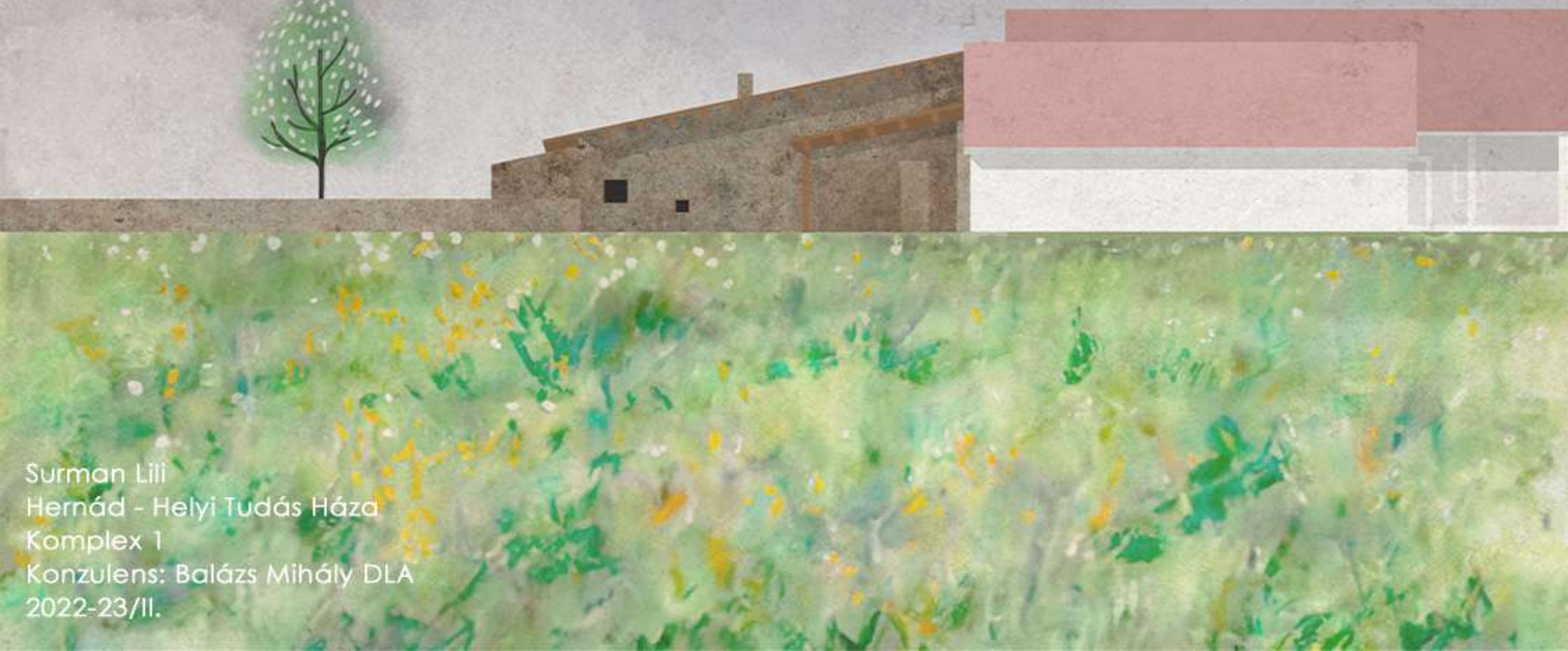
Meglévő tanyasi ház