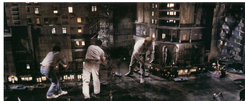
kép: Tim Burton: Corpse Bride - 2005 kép: Tim Burton: Batman - 1989