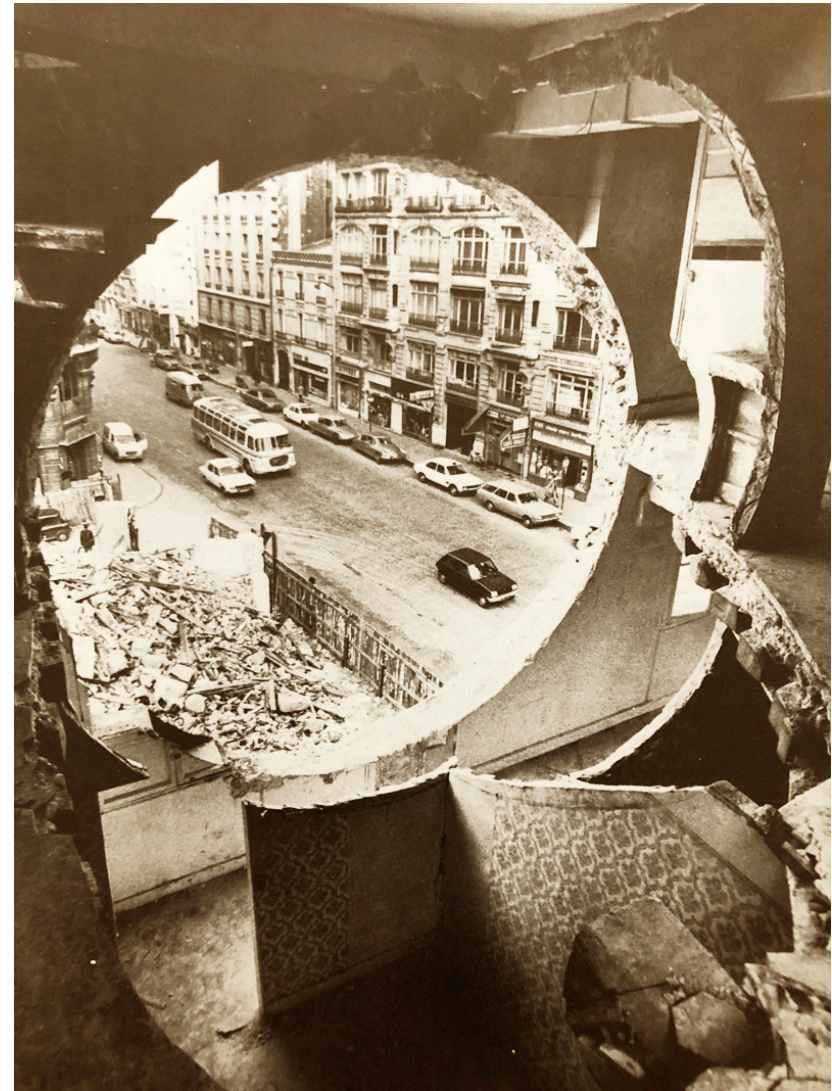
Kép: Gordon Matta-Clark: Conical Intersect 1975