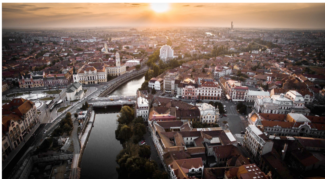
* Nagyvárad látképe, madártávlat