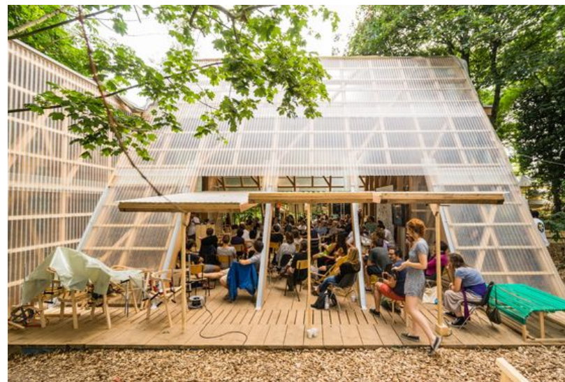
ConstructLAB, Oshtang Project, Darmstadt, 2014

A gondolat összegzésére alkalmas egy-perces film, technikája tetszőleges. Mutassa be a tervezett tér időbeli (pl. bevilágítás) változásait, külső térkapcsolatainak esetleges szabályozhatóságát. A pályamunkákat a TDK-konferencián vetített képes előadás formájában kell ismertetni.