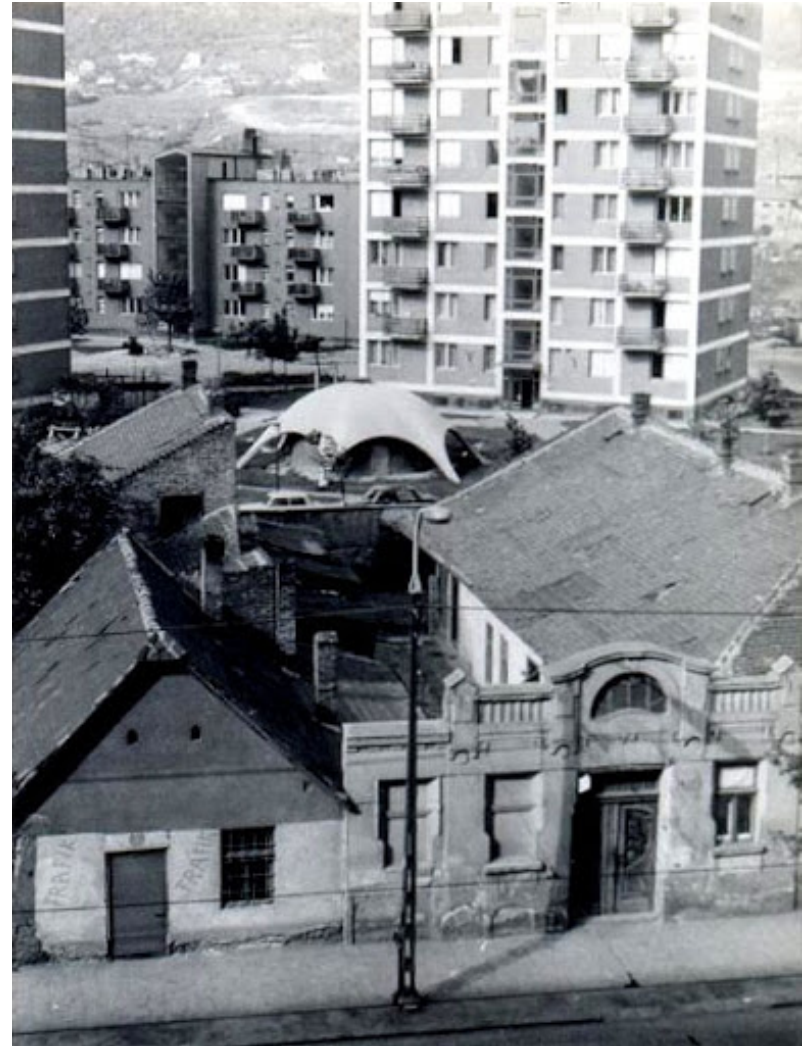
A gázfogadó a lakótelep építésének pillanatában.