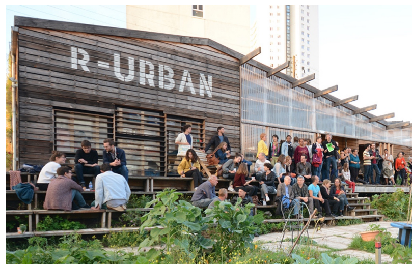
R-URBAN, Párizs, 2017