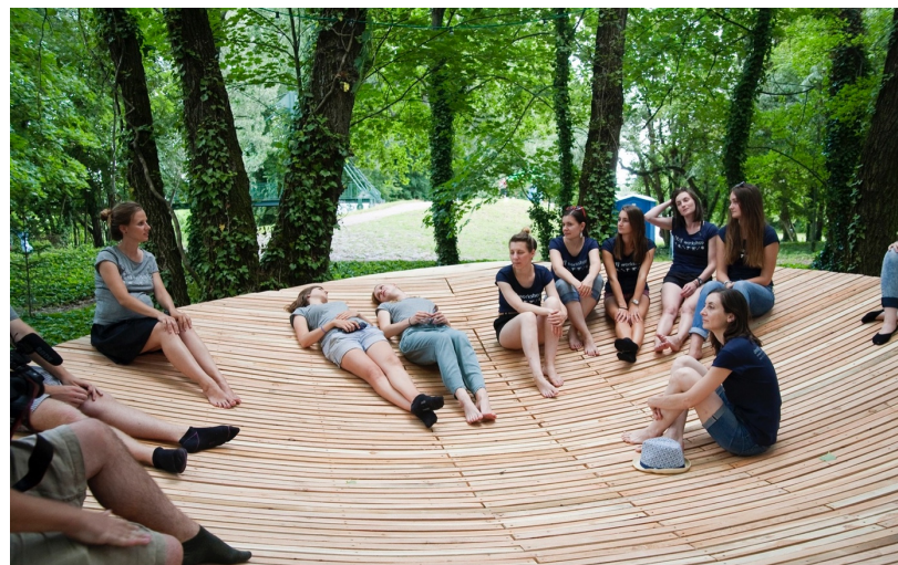
Woven, Installáció, Piestany, Szlovákia, 2016