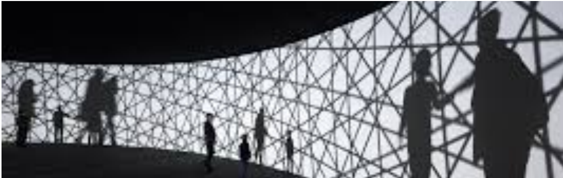
Olafur Eliason, fényinstalláció