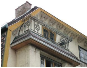
Sgraffito-díszes homlokzat a Karap utca egyik házában

A Bírák és Ügyészek Egyesületének kis-svábhegyi házai késő szecessziós építészetünk legkedvesebb emlékei közé tartoznak. Míg a Wekerle-telep ismert látványossága és igen keresett környéke Budapestnek, kevésbé köztudott, hogy egy igen hasonló negyed a Kis-Svábhegy déli lejtőjén is felépült. A Bírák és Ügyészek Lakótelepének csaknem negyven villáját, valamint az építetett bérházát és kollégiumát a kor egyik leghatásosabb építésze, Árkay Aladár tervezte változatos stílusban, ma már rendkívülinek tűnő igényességgel. Bár az elmúlt évszázad megtépázta a házak szépségét, azért ma is megakad rajtuk az arra sétáló szeme.